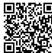
※ファミリーマートカードIDキャンペーンモバイルサイト

株式会社ファミリーマート、ファミマクレジット株式会社が提供する、ファミリーマートカードIDのサービス登録者に無料モバイルパズルゲームをプレゼント。