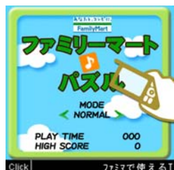
「ファミリーマート♪パズル」